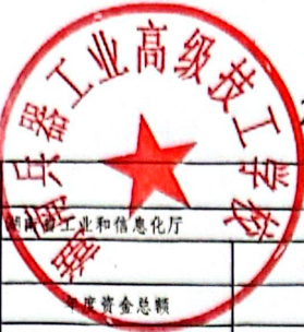
2024年度项目支出绩效评价表