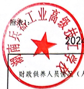
2024年度部门整体支出绩效评价基础数据表