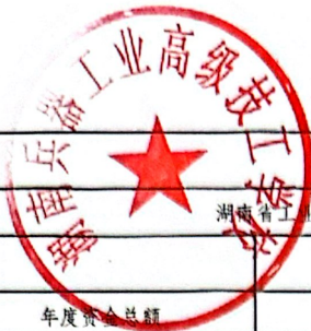
2024年度项目支出绩效评价表